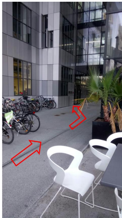
Gleich wieder rechts (nach dem Gastgarten)