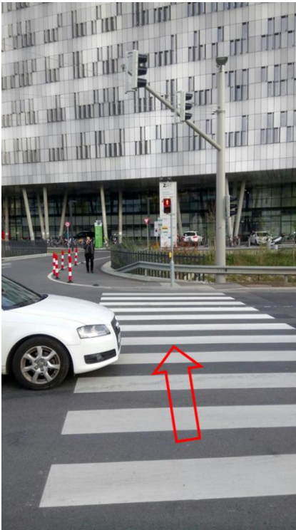
Über den Zebrastreifen