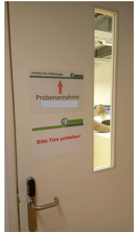
Probeneinwurf (außerhalb der Dienstzeiten) und Eingang zur Probenannahme (nach der Glastür sofort links)