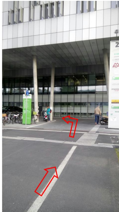
Vor der Impfambulanz links abbiegen bis zum Café Medicus