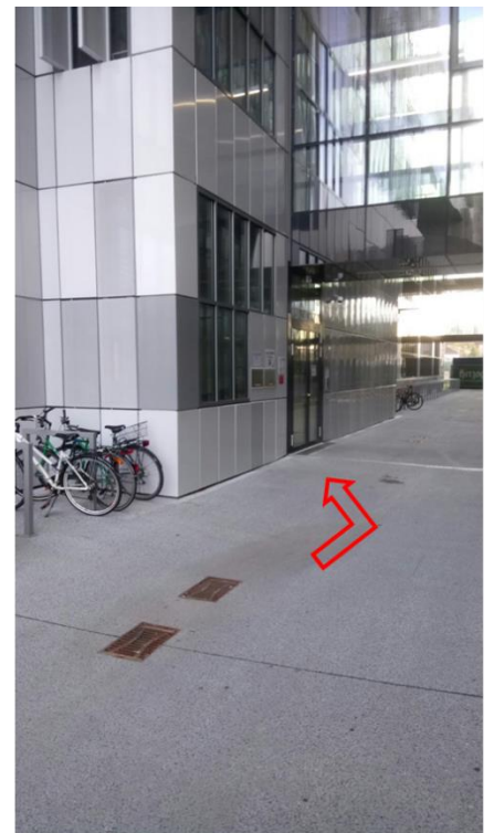
Die erste Tür links: hier befinden sich Probeneinwurf und Probenannahme