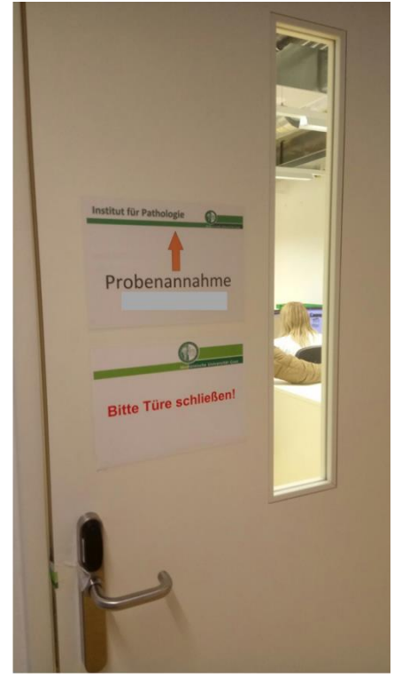
Probeneinwurf (außerhalb der Dienstzeiten) und Eingang zur Probenannahme (nach der Glastür sofort links)